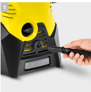
1 Система Quick Connect