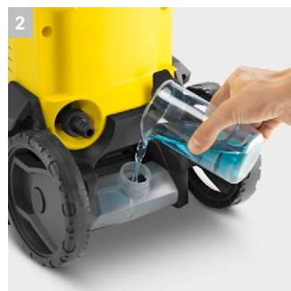
2 Бак для чистящего средства